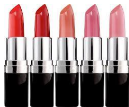
FARBY NA PLOTY