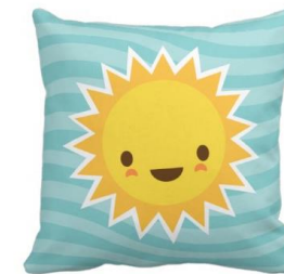
VANKÚŠ SO SLNIEČKOM