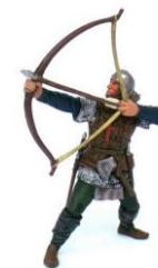
VOJAK S LUKOM