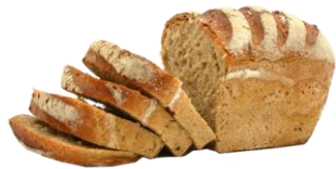
CHLIEB S CIBUĽOU