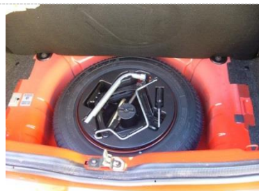
NÁHRADNÉ KOLESO, KLÚČ, ZDVIHÁK