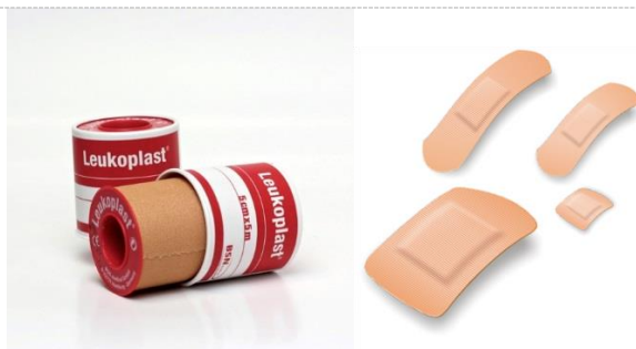
NÁPLAŠŤ HLADKÁ NÁPLAŠŤ S VANKÚŠIKOM