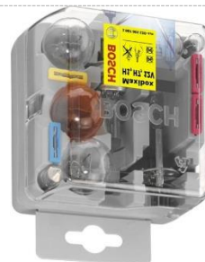
NÁHRADNÉ ŽIAROVKY A POISTKY