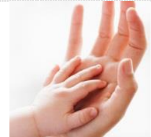
DRŽANIE ZA RUČIČKU