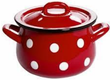
VARILA MYŠIČKA KAŠIČKU