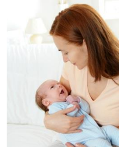
KOLÍSANIE AKO BÁBÄTKO