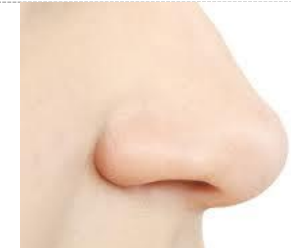
FRČKA DO NOSA