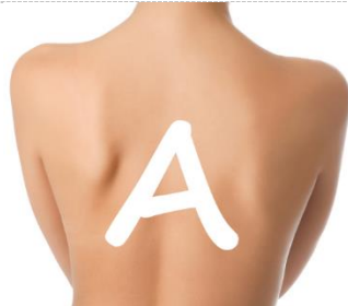
PÍSANIE PÍSMEN NA CHRBÁTIK